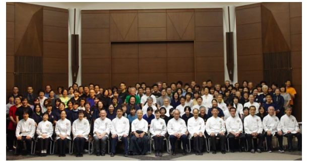
参加された方には「集合写真」をお配りしています